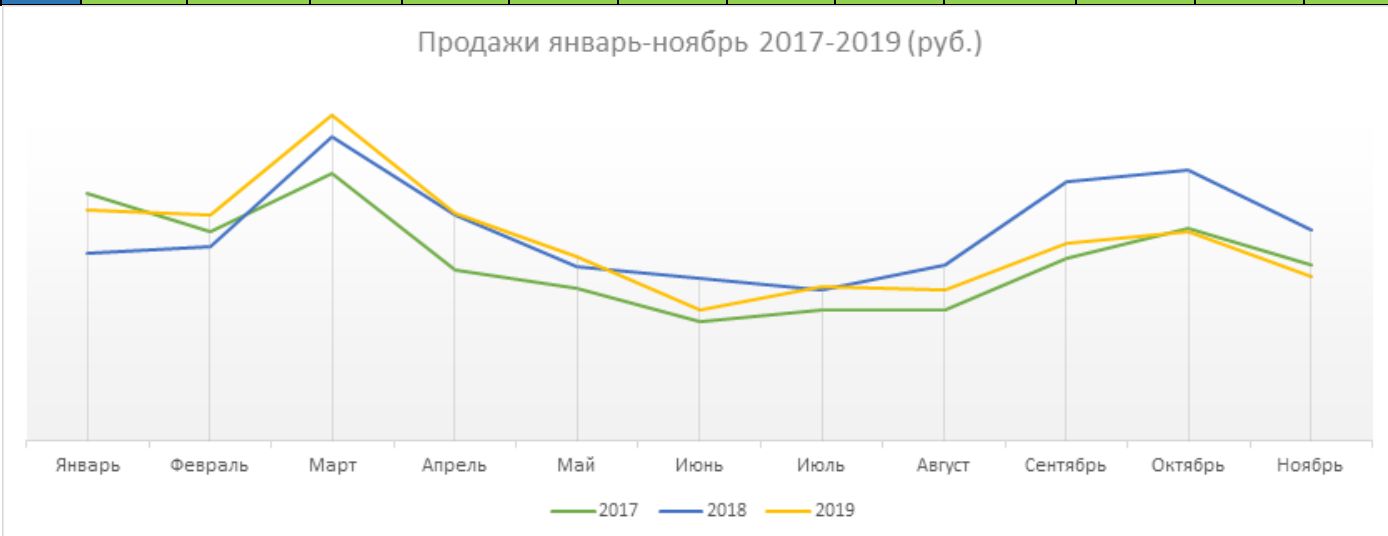
Изменения продаж в рублях